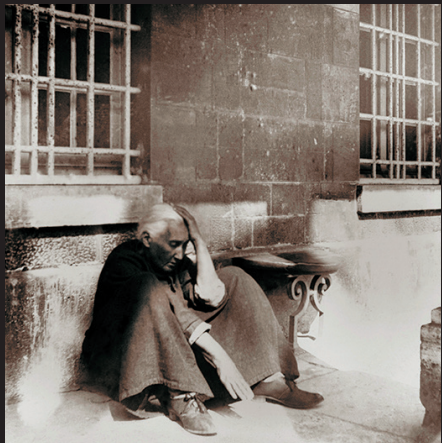
↑ Robert Demachy [1859-1936] "Folles" vers 1895